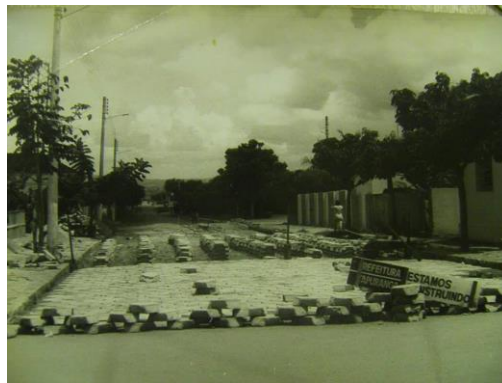
Figura 7: Calçamentos das ruas do Xixá na década de 1970. Fonte: https://www.facebook.com/xixazao.amax/photos_all . Acesso em: Jun. 2016.

Dona Maria de Lourdes Pessoa Ordenes, de 60 anos, que residiu no distrito Lages de Itapuranga-GO por 30 anos, relatou também sua vida quando jovem. Mesmo residindo em um distrito, frequentava com assiduidade a área central da cidade. Presenciou, por exemplo, uma novidade que trouxe novos ares de modernidade: o calçamento das ruas da cidade com bloquetes (figura 7), na década de 1970.