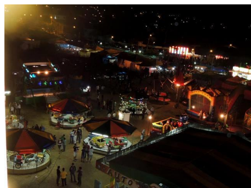
Figura 9: Festa do Povo de 2015, na famosa Baixada do Xixazão. Figura 10: Parque na Festa do Povo, de 2015.

Ainda que passem por transformações inerentes à cultura e a aspectos econômicos, Lima (2016) considera que as festas comunitárias, como a Festa do Povo, são