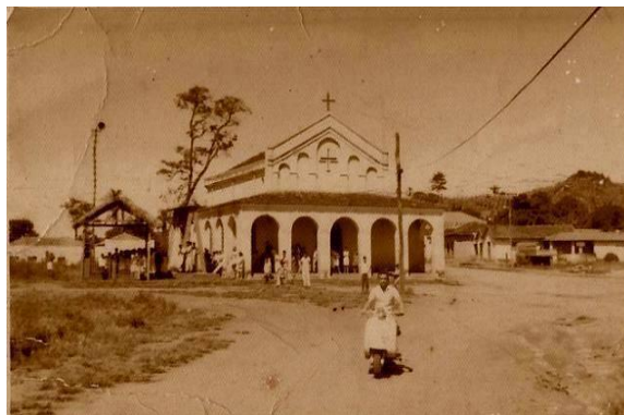
Figura 8: Igreja Matriz Nossa senhora de Fatima (antigo Xixá, atual Xixazão).