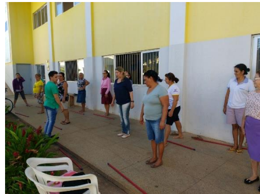
Figuras 1 e 2: Exercícios aplicados pelo fisioterapeuta no Conviver . Jun/2016.