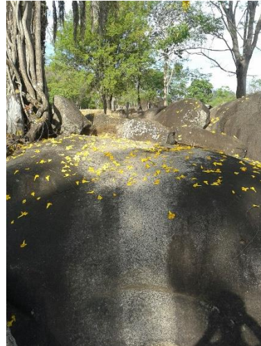
Figuras 5 e 6: Formações rochosas localizadas na região da Serrinha, em propriedade de Divino Correa.

A formação da cidade de Itapuranga foi acentuada com o surto migratório para Goiás, principalmente de mineiros, advindos de várias regiões deste estado. Desde o povoado do antigo Xixá, constituiu-se uma série de propriedades rurais, nas quais os trabalhadores procuravam viver com os poucos recursos e buscavam os produtos industrializados na cidade de Vila Boa (Goiás-Go), sendo transportados em lombos de animais, com as bruacas, o que deu origem aos chamados tropeiros.